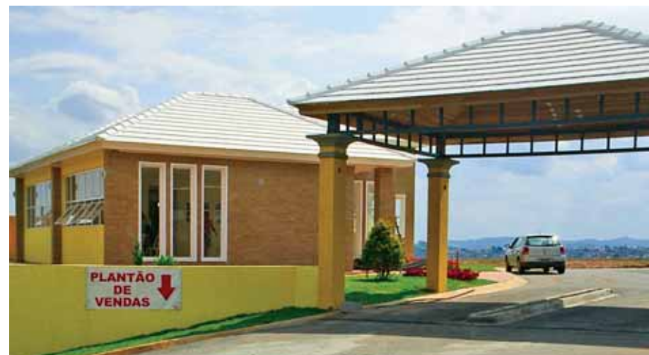
Altos da Floresta Residencial: 100 lotes vendidos em apenas 90 dias

Tudo isso justifica os sucessos de vendas alcançados por alguns