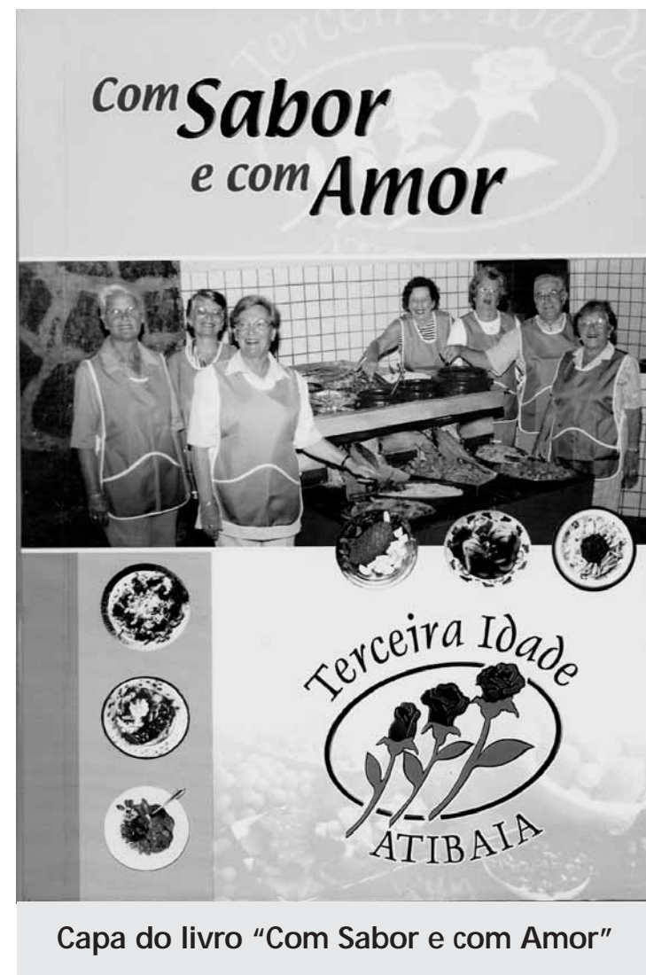
Capa do livro "Com Sabor e com Amor"

O livro reúne receitas para preparos de bebidas,