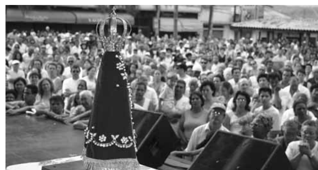
Imagem de Nossa Senhora de Aparecida que foi recebida e louvada por milhares de pessoas em evento religioso realizado em frente a Igreja do Rosário