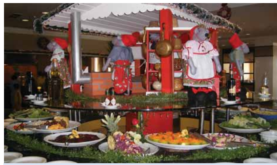
Buffet de saladas do restaurante do Bourbon Hotel & Resort

Para os que preferem os lanches rápidos, no centro da cidade há a Hamburgeria Papajoe's, lugar