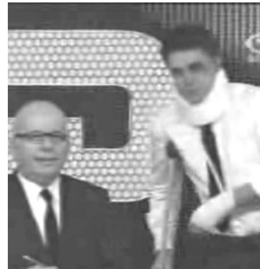
O dia seguinte...:-)