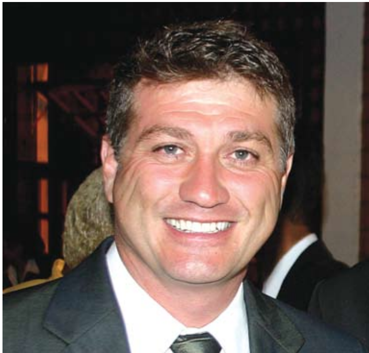
Prefeito Beto Tricoli

AM - Qual a avaliação que você faz sobre os segmentos abaixo: os principais feitos e conquistas e o que ainda há a fazer, o que recomendaria para o próximo governo.