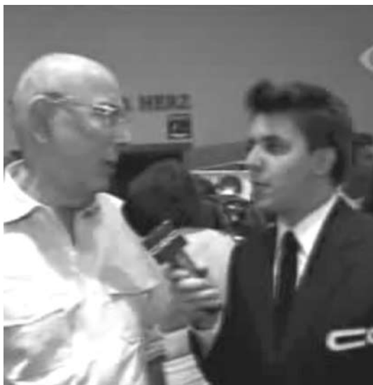
A entrevista com Hector Babenco