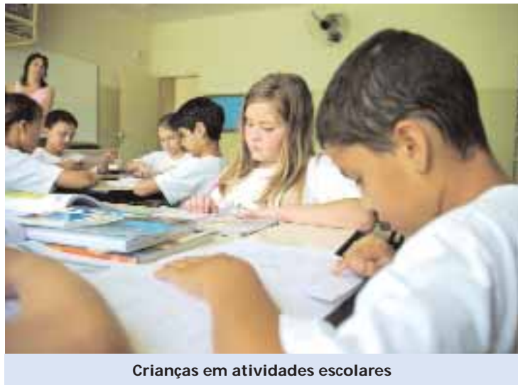
Crianças em atividades escolares

rantir seu funcionamento praticamente 365 dias por ano. E, para que isso aconteça, precisamos ter profissionais capacitados, valorizados e satisfeitos com suas carreiras. A Prefeitura tem prezado pela qualificação contínua de seus professores, técnicos e funcionários, com cursos de capacitação e incentivo à titulação. Hoje praticamente todos os nossos professores têm nível superior graças a programas de educação continuada e investimentos que garantiram bolsas de estudos em universidades. Aqueles que ainda não se formaram, estão em vias de concluir o curso. Nos últimos anos valorizamos