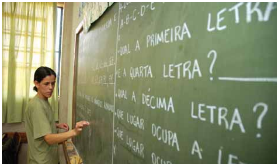
Professora em sala de aula de um colégio da cidade, representando nossa singela homenagem a todos os mestres de Atibaia

No mês do professor, veja um completo balanço sobre a educação na cidade.