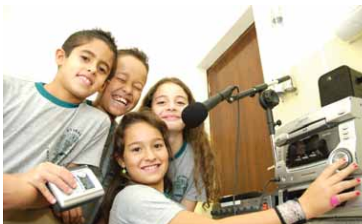
Atividades artísticas realizadas por alunos de escolas municipais

RS – Costumo dizer que construir uma escola para 500 estudantes é a parte mais fácil desse trabalho. O mais complicado é mantê-la, é ga-