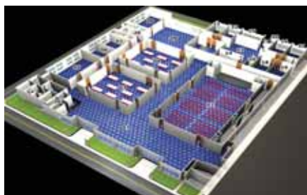
Planta do centro de convenções

Financiado pelo BNDES, grupo mineiro investe 32 milhões de Reais na cidade.