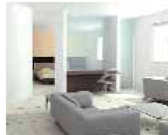
Imagem 3D de uma das suítes