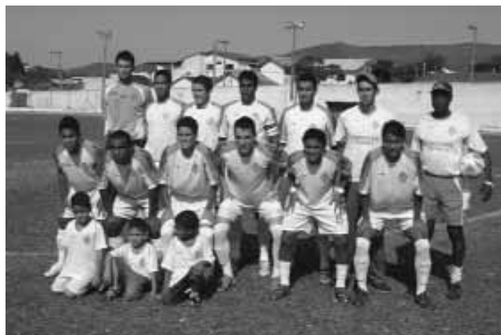
Equipe de 2007 pronta para mais uma partida

O Sport Club Atibaia é o time de futebol da cidade de Atibaia, interior do Estado de São Paulo.